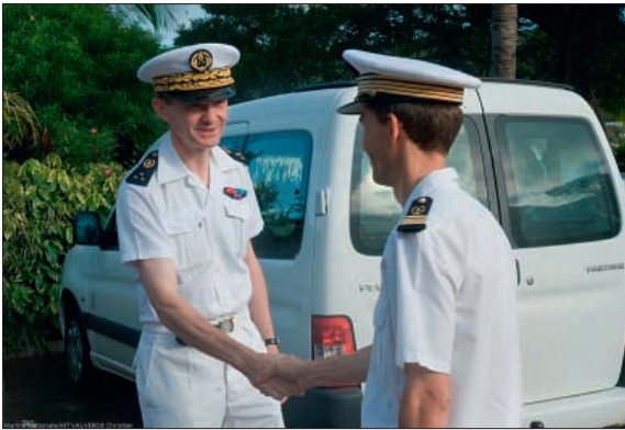
Le directeur général du SHOM en inspection au GOP