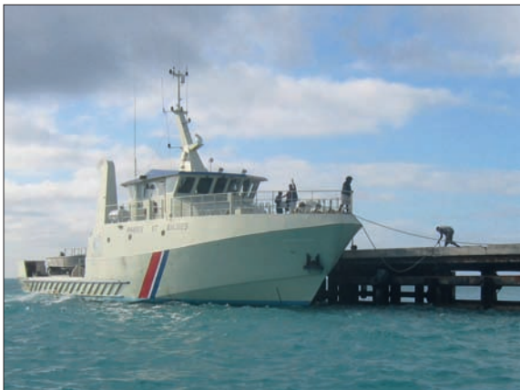
Le Louis Hénin à Ouvéa