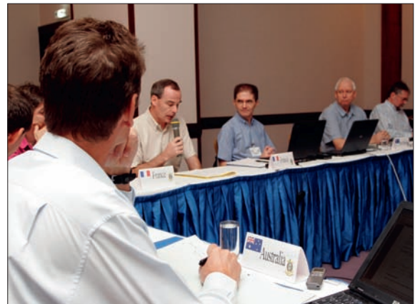
8 e CHRPSO 1 à Tahiti