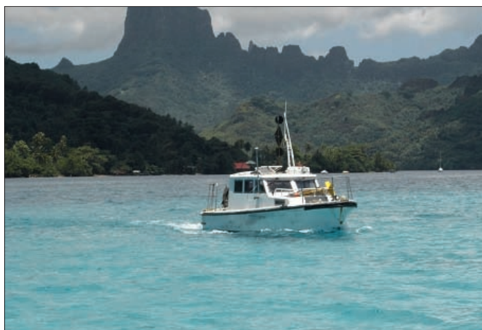
Levé topographique à Moorea