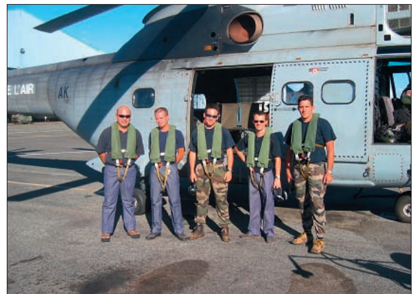
Reconnaissance vers Tiga en Super Puma