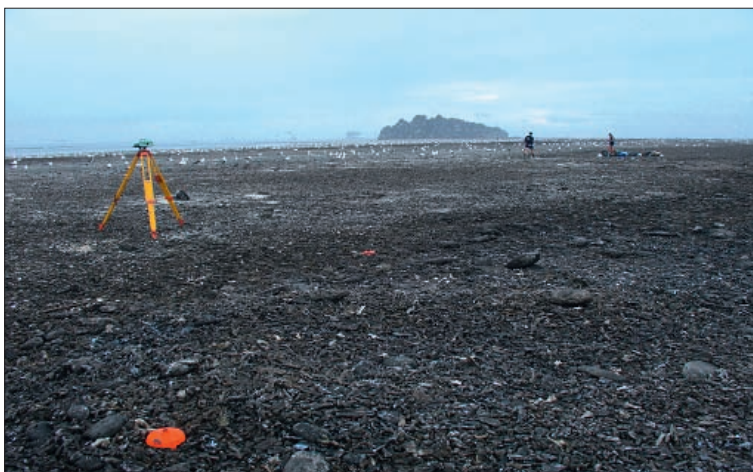
Travaux géodésiques à Clipperton