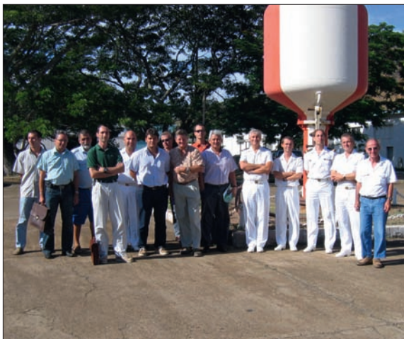
Commission hydrographique à Nouméa