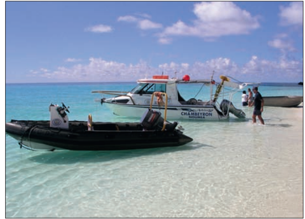
Travaux hydrographiques à Beautemps-Beaupré