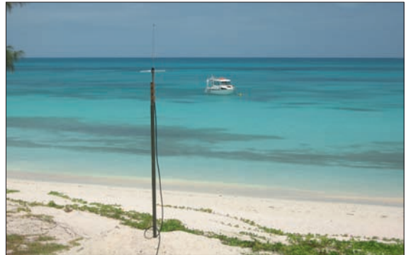
Plageage à Ouvéa