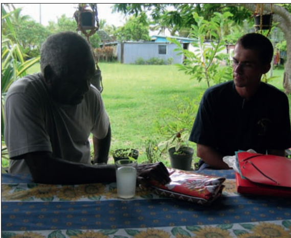
Coutume à Tiga