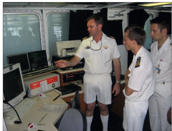
Visite à bord de l'HMS Melville