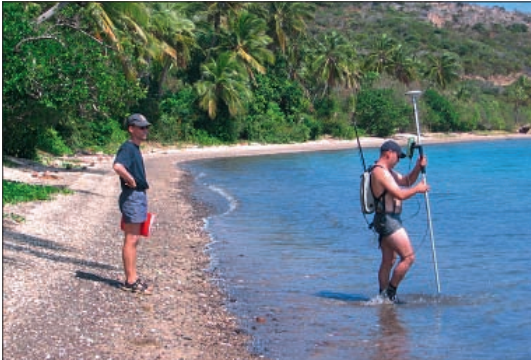
Levé topographique au GPS Leica aux Belep