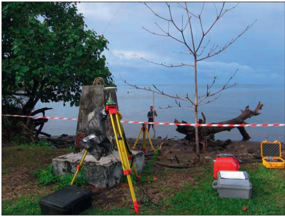
Travaux géodésiques à Vanikoro